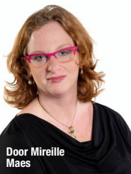
Door Mireille Maes